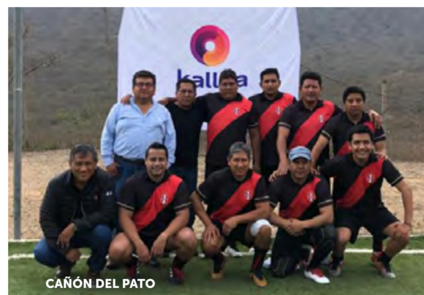
CAÑÓN DEL PATO