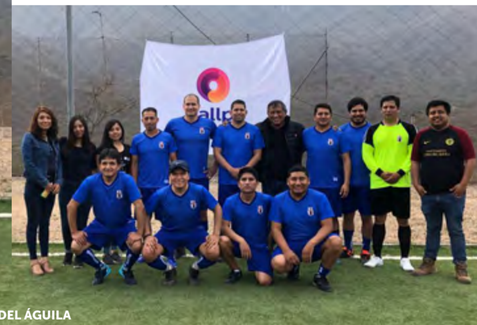
CERRO DEL ÁGUILA

EL CAMPEONATO INTERSEDES KALLPA 2019 SE REALIZÓ EL 9 Y 29 DE NOVIEMBRE EN LAS SEDES LIMA Y CARHUAQUERO, RESPECTIVAMENTE. En esta edición, buscamos la participación de todas las sedes con el objetivo de lograr la integración entre cada una de ellas. Se formaron dos grupos: Grupo 1 (CT Puerto Bravo, CT Kallpa, Plantas de Gas y Fraccionamiento, CT Aguaytia y Oficinas San Isidro) y Grupo 2 (CH Cerro del Águila, CH Cañón del Pato y CH Carhuaquero).